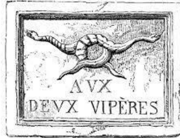
Rue Raisin, 7.

Année 1826 : 12 rue Raisin ou rue Jean-de-Tournes - 69002 - Lyon