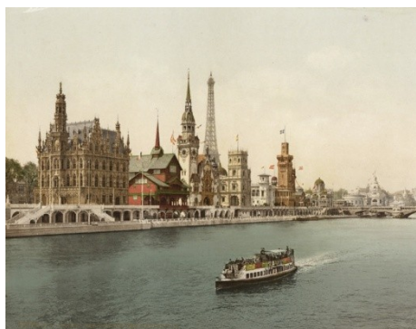
Exposition universelle de Paris : les gigantesques palais des nations

L'exposition ou le seuil d'une ère dont les savants et les philosophes prophétisent la grandeur et dont les réalités dépasseront sans doute les rêves et les imaginations.