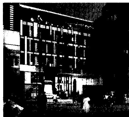
> Zoom sur la « Loge des Fous »

Au centre de la cour Saint-Élisabeth se trouvera un bâtiment de verre et de métal, lumineux et transparent. Par des jeux de pleins et de vides, la nouvelle Loge des fous offrira une vision originale sur le site et accompagnera dans la fluidité les déplacements des visiteurs d'une cour à l'autre. Cette zone centrale accueillera commerces, bureaux ainsi que deux restaurants.