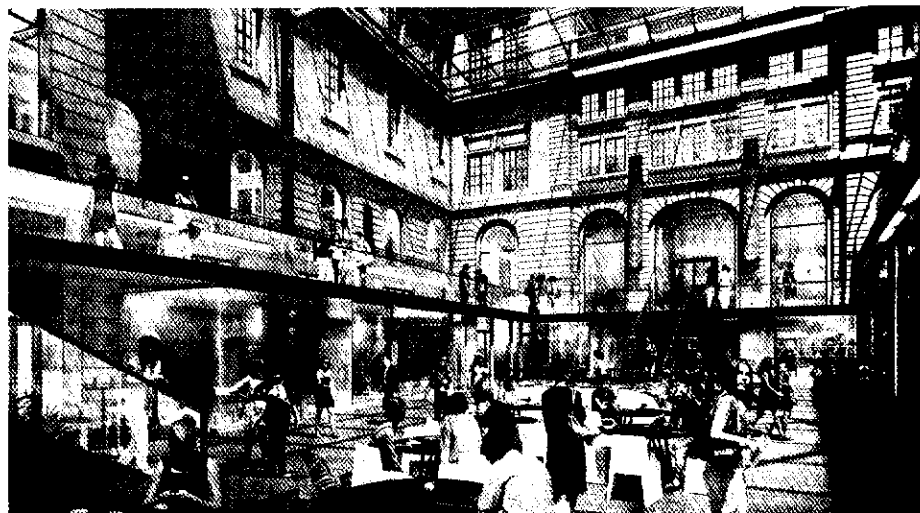
> Passage de l'Hôtel-Dieu, vue depuis la cour basse

Aujourd'hui, le « Passage de l'Hôtel-Dieu » renaît pour faire de l'ancienne cour du Midi un pôle d'attraction dédié à la thématique culinaire. Ce nouvel espace, conçu autour d'une cour creusée à l'instar du célèbre marché couvert londonien, Covent Garden, avec ses différents niveaux de commerces, se veut ouvert, convivial et accessible.