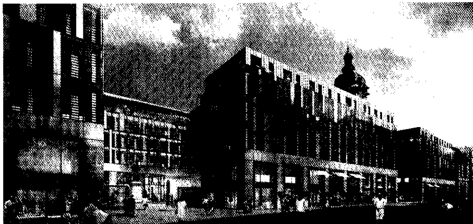
> Perspective de la rue Bellecordière

La rue Bellecordière deviendra la troisième façade qui manquait à l'Hôtel-Dieu, grâce à l'enfilade de boutiques qui vont l'habiller. La construction d'une série de trois bâtiments neufs aux lignes contemporaines crée une véritable respiration architecturale, en rupture avec son image actuelle de rue passante, de service. Donnant la priorité aux piétons, cette rue changera de visage pour retrouver animation et attractivité, en faisant la part belle aux terrasses et aux vitrines.